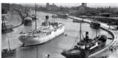
1. Kanał portowy i Moloporty przed wojenną wojną 2. Moloporty po wojnie, wiosna 1939 r.