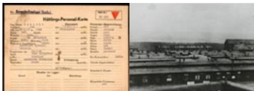
4. Oboz koncentracyjny Buchenwald