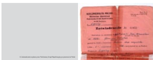
8. Zdobyczone wydanie przez Państwowy Urząd Repatriacyjny po powrocie do Polski

Wyzwolony przez wojska amerykańskie 12 kwietnia 1945 roku w czasie marszu ewakuacyjnego więźniów z podobozu. Do Polski wrócił w czerwcu 1946 roku.