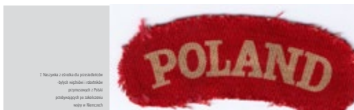
7. Naczelnik z obozów dla przesiedleńców byłych więźniów i robotników przymusowych z Polski przyjeżdżających po zakończeniu wojny w Niemczech

14 kwietnia 1944 roku w zbiorowym transporcie przewieziono go ze Stutthofu do KL Neuengamme koło Hamburga. Tam znów przeszedł „ceremonię powitalną”, otrzymał też nowy numer: 29238. Jednak pobyt w tym obozie znów nie trwał długo; po kilku tygodniach w kolejnym transporcie przewieziony został z Neuengamme do obozu Buchenwald koło Weimaru. Oznaczony został w nim numerem 50681 oraz czerwonym trójkątem polskiego więźnia politycznego. Większość pobytu w KL Buchenwald spędził w jednym z podobozów tego obozu w górach Harzu, gdzie pracował przy drążeniu sztolni podziemnych fabryk zbrojeniowych. W czasie pracy tam działał w obozowym ruchu oporu pomagając słabszym i zagrożonym kolegom.