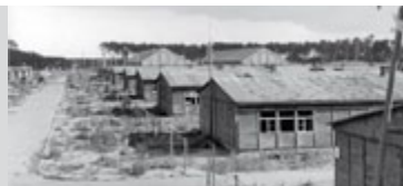
2. Blok nr 6 w Nowym Obozie, Stutthof 1943 r.

W Stutthofie wykonywał ciężkie prace fizyczne, m.in. przy produkcji prefabrykatów betonowych w należącej do obozu cegielni oraz przy budowie baraków. Większą część pobytu w obozie mieszkał na bloku nr VI na Nowym Obozie, zaraz przy głównej bramie wejściowej na teren tego kompleksu.